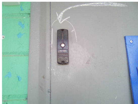
фото 2 - 3