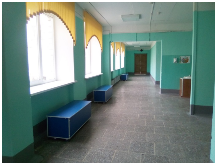
фото 13 - 16